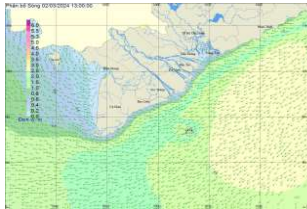
Hình 2: Bản đồ sóng dự báo lúc 13h00 ngày 02/03