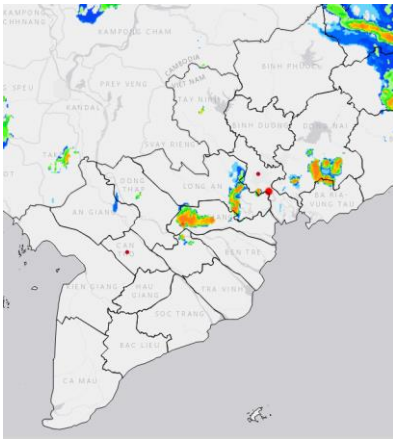
Ảnh radar thời tiết