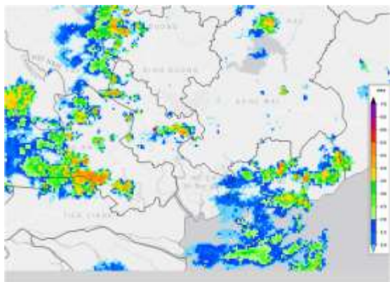
Ảnh radar thời tiết