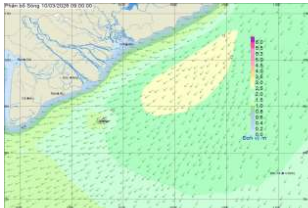
Hình 2: Bản đồ sóng dự báo lúc 09h00 ngày 10/03