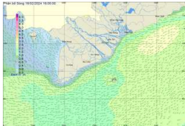
Hình 2: Bản đồ sóng dự báo lúc 16h00 ngày 16/02